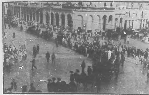
Carro fúnebre y presidencia del duelo.