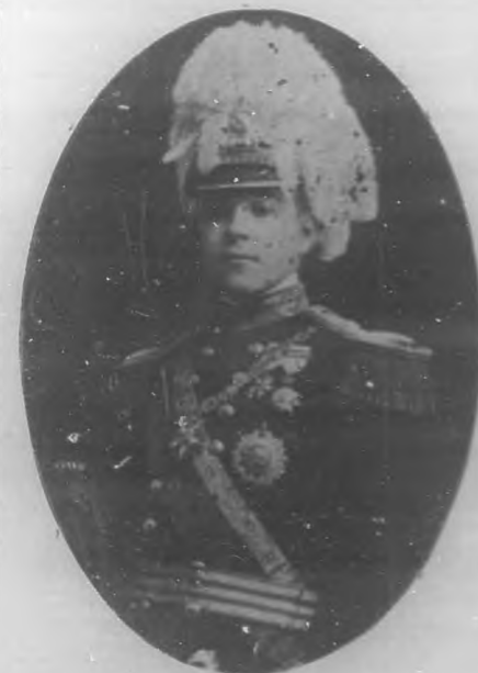
El Rey Don Mannel II