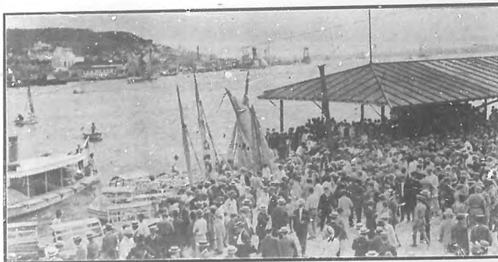
El público en los Muelles de Caballería, esperando los restos de Aguilera.