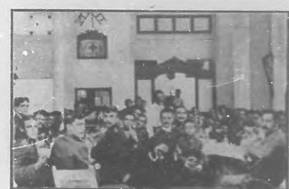
En Casa Blanca.—Batujón celebrado en conmemoración del aniversario de la fundación del Cuerpo de Bomberos.