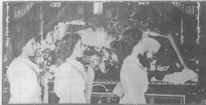
Los huérfanos de la Patria haciendo guardia de honor á los restos de Aguilera en el Ayuntamiento.