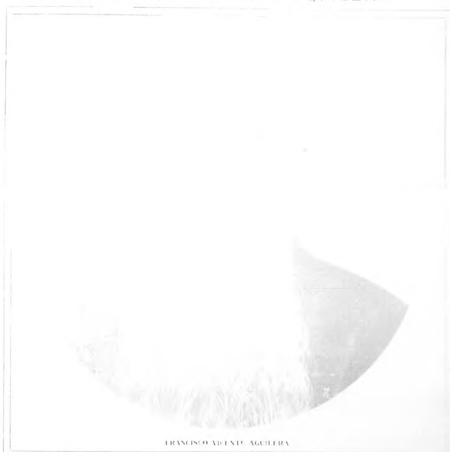
FRANCISCO VICENTE AGUILERA

Nació en Bayamo este patriota inmaculado, cuya existencia no se empañó con la más leve mancha. Todo lo sacrificó, absolutamente todo en aras de la Patria, hacienda, afectos del alma y la vida misma. De carácter bondadoso, dulce y apacible, no podía ser un revolucionario en el verdadero sentido de la palabra, pero con la conciencia de su deber sobrepuesto al todo, persiguió un ideal, fue amargado y llegó hasta el sacrificio en aras de su amor a la libertad y a la independencia de Cuba.