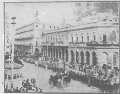
Presidencia y tropas que concurrieron al acto á ser paso por el ganjal.