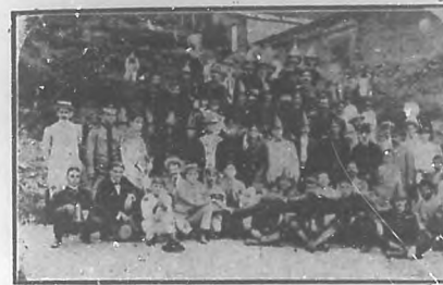
En Casa Blanca.—Grupo del personal de Bomberos de Casa Blanca y representaciones de los Bomberos de la Habana.