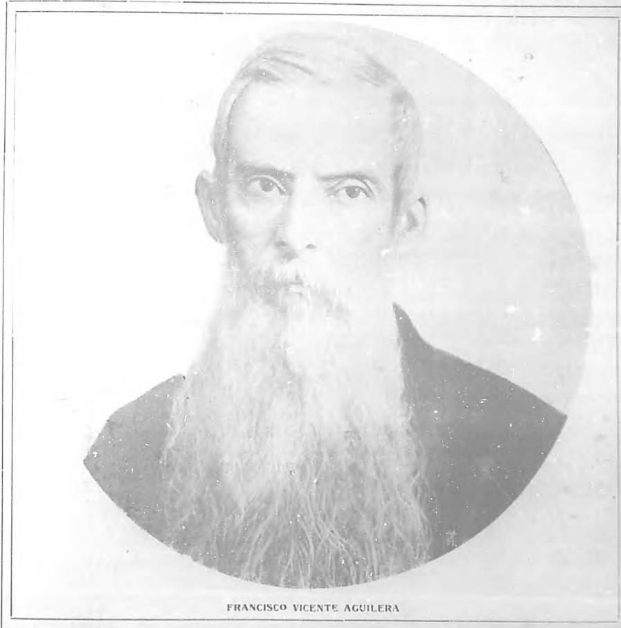
FRANCISCO VICENTE AGUILERA

NACIÓ en Bayamo este patriota immaculado, cuya existencia no se empañó con la más leve mancha. Todo lo sacrificó, absolutamente todo en aras de la Patria: hacienda, afectos del alma y la vida misma. De carácter bondadoso, dulce y apacible, no podía ser un revolucionario en el verdadero sentido de la palabra; pero con la conciencia de su deber sobrepuesto á todo, persiguió un ideal, fué tenaz y llegó hasta el sacrificio en aras de su amor á la libertad y á la independencia de Cuba. Carlos Manuel de Céspedes, que tenía mirada de águila, creyó que si había un patriota que podía decir como Dios: "á la ola del mar: 'de aquí no pasarás'", ese patriota era Francisco V. Aguilera. Y de la manigua cubana ipé á Nueva York como el ramo de olivo y su corazón abierto —como siempre— de par en par. Allí fué aclamado con ferviente entusiasmo, inclinándose todos ante la virtud acrisolada; pero fuerza es confesarlo con amargura: la ola no fué detenida.