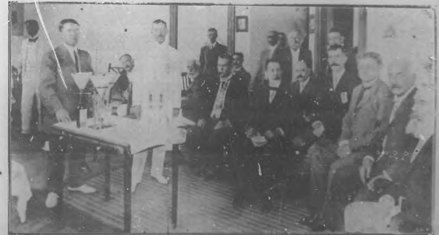
GRUPO DE DISTINGUIDAS PERSONALIDADES PRESENCIANDO UN EXPERIMENTO

Y lo que es más importante, para la salud; pues sabido es la influencia del agua, más ó menos purificada, en nuestro organismo.