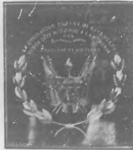
Corona de plata ofrecida por la emigración cubana de Cayo Hueso, á Francisco V. Aguilera.