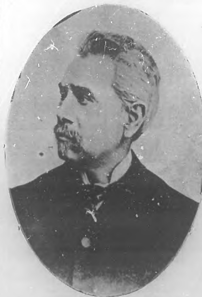
Sr. Teófilo Braga, Presidente de la República Lusitana.