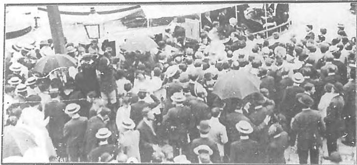
El remolcador que condujo los restos á la Capitanía de Puerto.

La vista de estos dos personajes inspira una serie de consideraciones: tristes unas, y de comiseración para el caído; de íntima satisfacción para el vencedor. . . . Y por sobre ellas, la de que el pueblo es inexorable con los que tilda de malos administradores de sus intereses, y de que no hay fuerza, ni institución secular que le resista, cuando á velar por aquellos se decide.