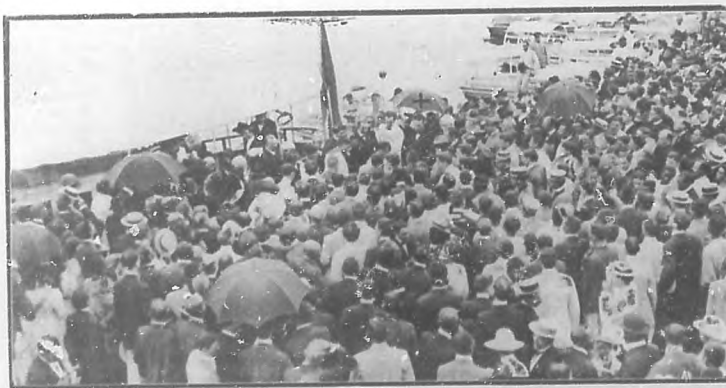
El Presidente de la República (inducido en el grabado con una cruz) ante los restos de Aguilera, después del desembarque.